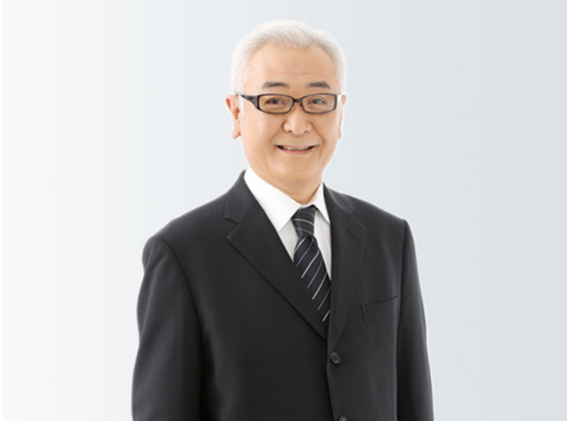
理事長 □□ □□

すくすく保育園は0000年の設立以来、多くの皆さまに支えられ福祉事業に邁進してまいりました。