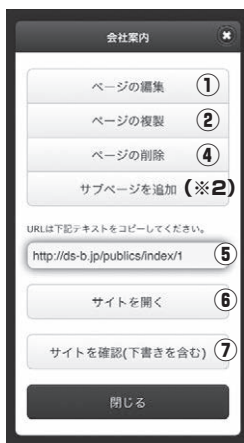
■【管理画面】ページ操作画面