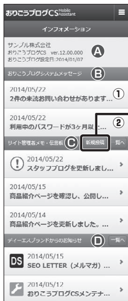
■【管理画面】インフォメーション