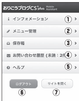
■【管理画面】操作メニュー画面 (ログイン時)