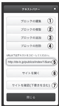
■【管理画面】ブロック操作画面