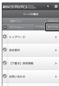
■【管理画面】ページの構成