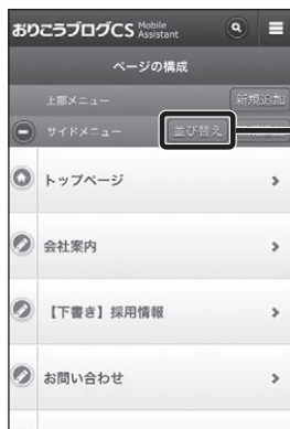
■【管理画面】ページの構成

(※)おりこうブログCSプラス導入のお客様は、「ページ並び替え画面」からサブページなどの階層変更を行うことができます。 編集を行う場合は、☰ ボタンをタップします。