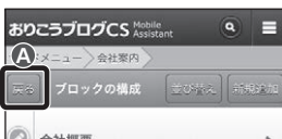
■【管理画面】ブロックの構成