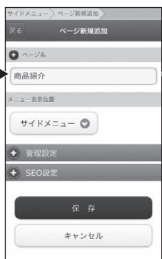
■【管理画面】ページ新規追加