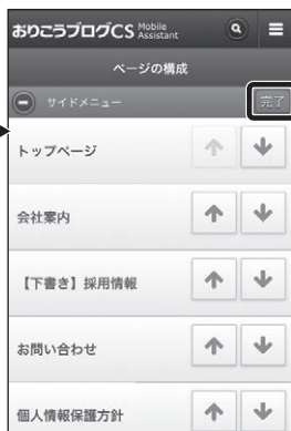
■【管理画面】並び替え画面