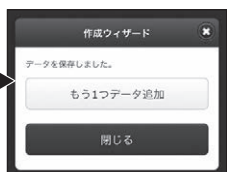
■【管理画面】作成ウィザード