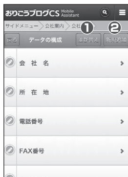
■【管理画面】データの構成