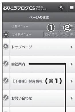
■【管理画面】ページの構成

操作メニュー画面の「メニュー管理」をタップすると「ページの構成」画面が表示されます。「メニュー管理」では、ホームページ内の各要素の編集を行います。