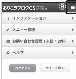
■【管理画面】操作メニュー画面