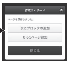
■【管理画面】作成ウィザード