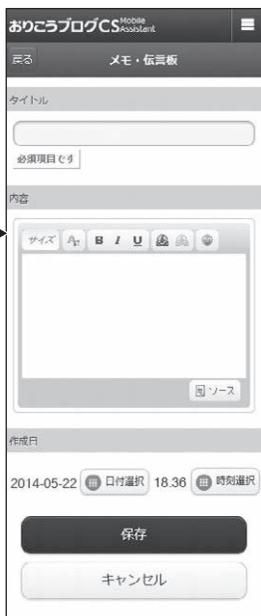
■【管理画面】 管理者・メモ伝言板新規追加画面