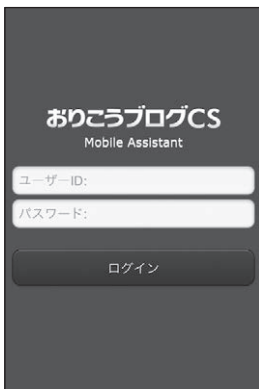
■【管理画面】ログイン画面

管理画面ログインページ URL http:// お客様のドメイン/users/login/