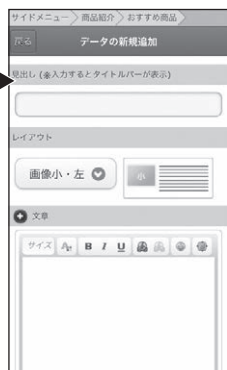
■【管理画面】データ新規追加