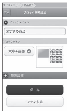
■【管理画面】ブロック新規追加