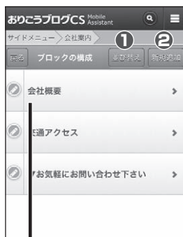
■【管理画面】ブロックの構成

(※2)おりこうブログCSプラス導入のお客様は、「ページ操作画面」からサブページの追加を行うことができます。