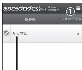
■【管理画面】フォルダー一覧