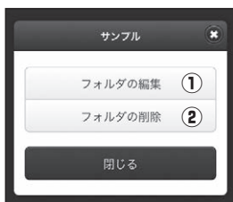
■【管理画面】フォルダ操作画面