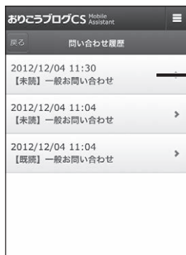
■【管理画面】問い合わせ履歴