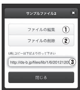
■【管理画面】フォルダ操作画面