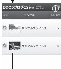
■【管理画面】ファイル一覧

ファイルの管理を行います。タイトルをタップすると、「ファイルの編集」画面が表示されます。